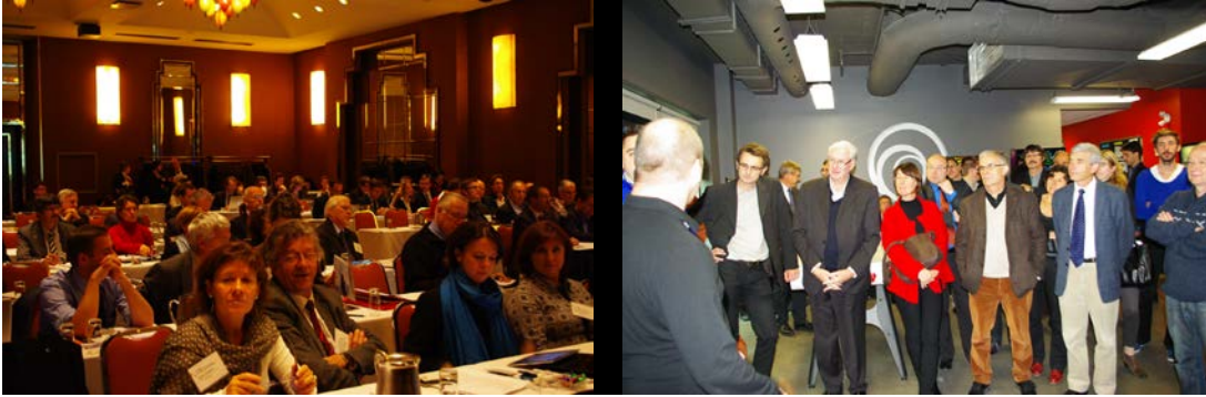
5-Présentations générales des territoires.